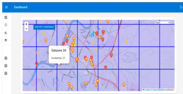
Figura 3. Mapa dividido por zonas.

Además, con las ubicaciones de los incidentes reportados se obtiene el "mapa del delito", en el cual se pueden visualizar los incidentes, su nivel de riesgo y demás información, y haciendo división de zonas en el mapa se pueden evidenciar las zonas donde han ocurrido más incidentes las cuales necesitan mayor atención por las autoridades.