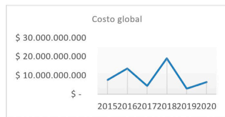
Figura 2. Costo global de estructuras autoportantes entre 2015 y 2020.

A partir de los resultados y hallazgos evidenciados en las secciones anteriores, en este apartado se diseñó un plan en el cual se establecen las medidas y acciones recomendadas para mejorar el manejo de los costos asociados a los proyectos asociados a estructuras ECAP.