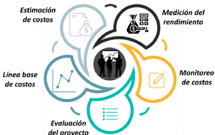
Figura 5. Estructura plan de mejoramiento gestión de costos proyectos ECAP.