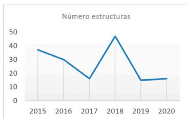
Figura 1. Número de estructuras realizadas entre 2015 y 2020.

En esta sección se relacionan los resultados obtenidos de la aplicación del diseño metodológico planteado en la sección anterior. En primer lugar, se presentan las características de las cubiertas autoportantes desde un análisis a nivel de infraestructura, posteriormente se comparan y analizan los costos de los últimos 5 años de los proyectos de cubierta auto portante realizados en el Ejército nacional de Colombia. Y por último, se presenta el diseño del plan de mejoramiento al manejo de los costos de los proyectos de cubierta autoportante implementado en el Ejército Nacional.