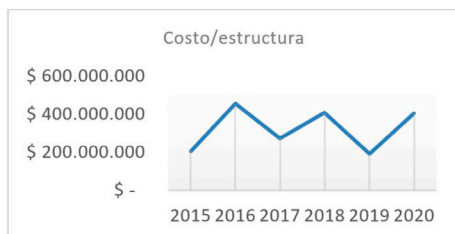
Figura 3. Costo por estructura entre 2015 y 2020.