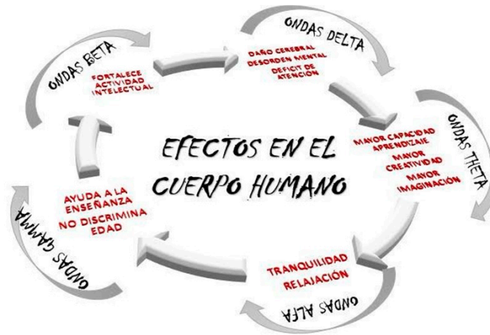
Figura 3. Tipos de ondas y su efecto en el comportamiento humano.

Lo anterior, resulta a partir de la revisión de material documental.